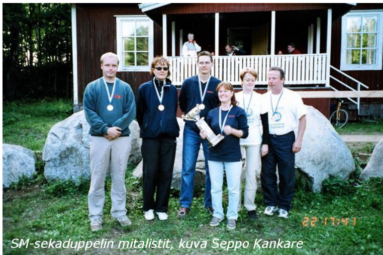
SM-sekaduppelin mitalistit