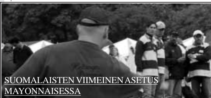
SUOMALAISTEN VIIMEINEN ASETUS MAYONNAISESSA