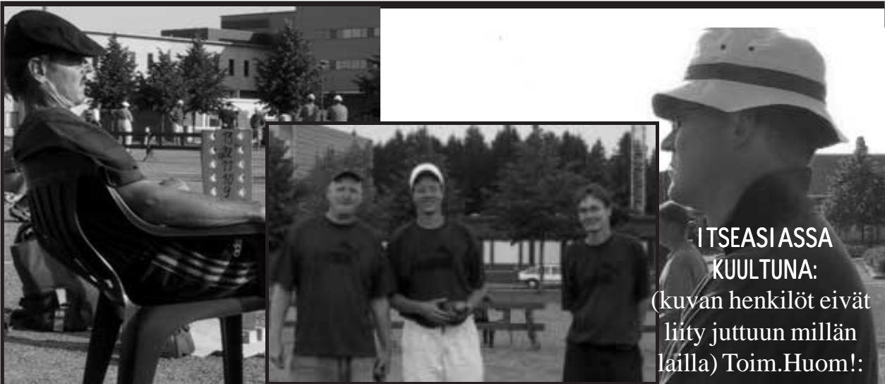
ITSEASSA KUULTUNA: (kuvan henkilöt eivät liity juttuun millän lailla) Toim.Huom!:

Dallasmaisten juontenkäänteiden kautta tai niistä huolimatta Joensuu järjesti niin SM-sarjan viimeisen kierroksen kuin naisten finaalit. Kelit olivat loistavat, järjestelyt pelasivat, majoitus oli halpaa ja parhaat voittivat.