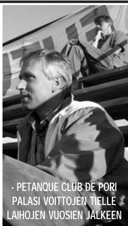
Seurakaveri oli jäänyt jännittämään naisten pelaamista.

-Saapa nähdä. Pää kestää kyllä mutta riittääkö taito, katsomossa arvuuteltiin muutaman kiperän tilanteen edessä. Amican Kalliosalo kertoi olevansa pettynyt mutta myönsi oikean joukkueen voittaneen. “Ei voi mitään, pelattiin huonosti”